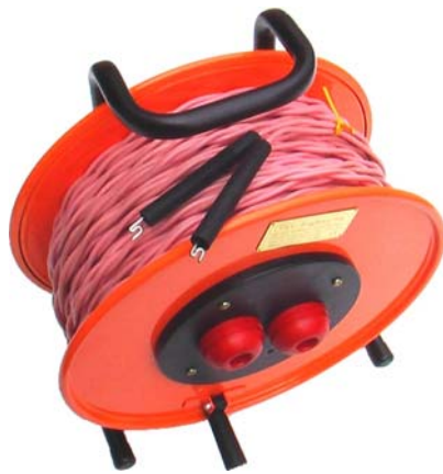
unbewickelt – Ref. 1068-000001

Die Schießleitungstrommel Porex ist eine stabile Konstruktion aus Stahlblech mit oranger Polyesterharzbeschichtung: